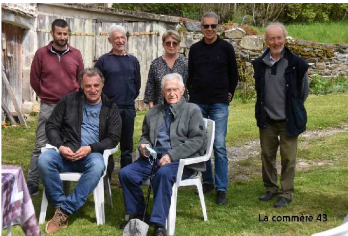
La commère 43