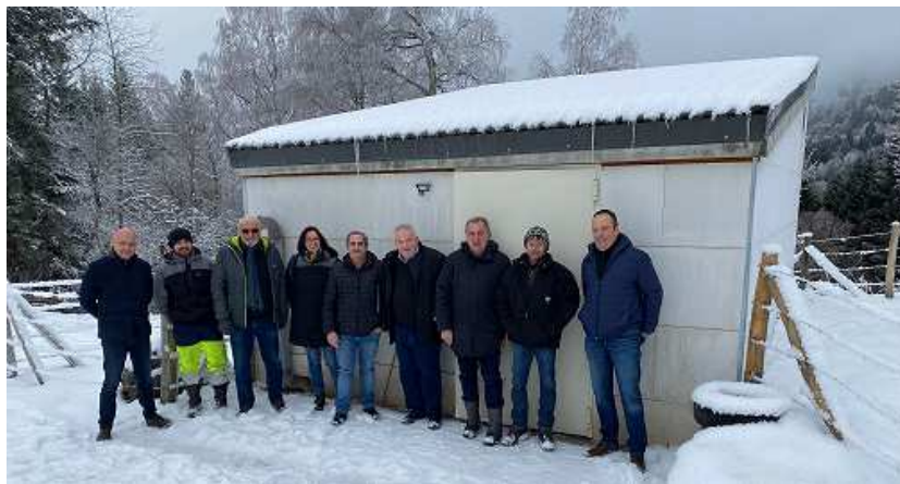
Maires des communes concernées et membres du syndicat des eaux de Velay rural

Le fait que notre réseau d'eau potable soit interconnecté avec les Communes voisines de Saint-Julien-Chapteuil et Saint-Pierre-Eynac et qu'il soit mutualisé dans le cadre du syndicat des eaux, nous a permis de résoudre définitivement et efficacement ce problème de qualité de l'eau, sans que la commune n'ait à en assumer la charge financière.